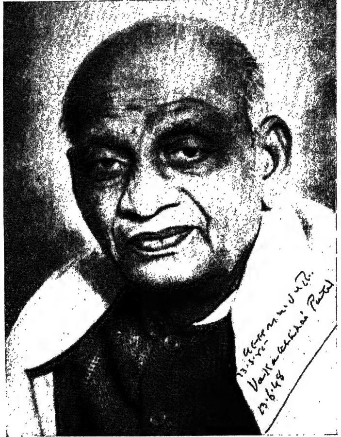
सरदार वल्लभभाई पटेल